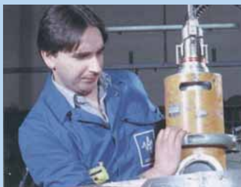
Fotografía de la portada: Uso de DTL en radiografía industrial (dosímetro termoluminiscente en un receptáculo especial).

Para obtener más información sobre las fuentes radiactivas selladas o la radiación en general, se debe establecer contacto con la entidad reguladora local. También puede consultarse el sitio web del Organismo Internacional de Energía Atómica, http://www.iaea.org